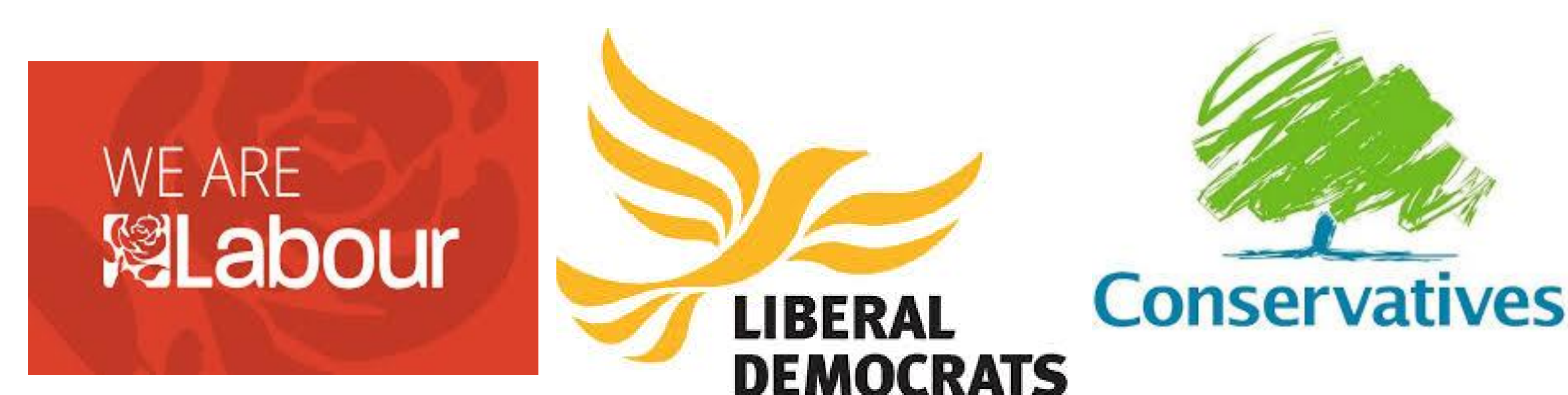
TABLA 1.0 Posición ideológica en Gran Gretaña a partir de propuestas en política pública